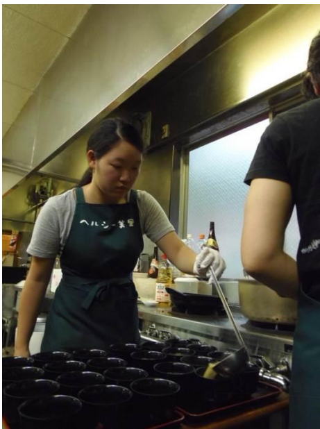
ヘルシー美里にて配膳サポート