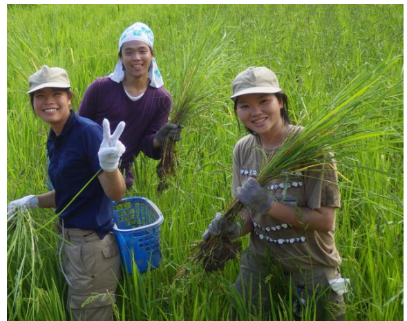
田んぼでの業務（夏） 昆虫調査も行っています。