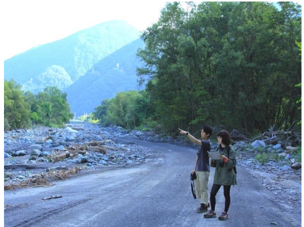
野鳥センサス調査に同行