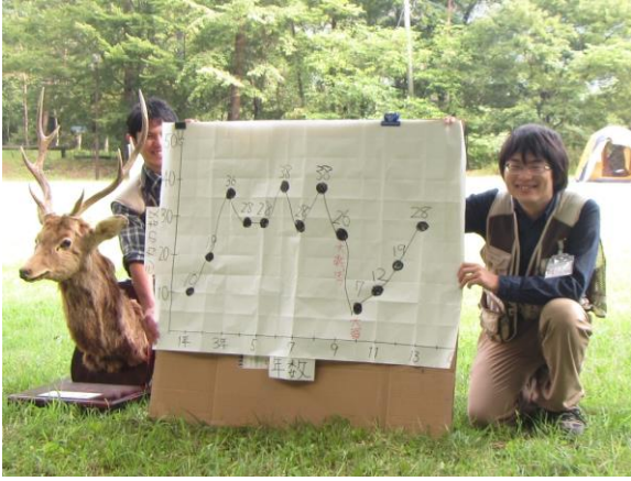
プログラムのサポート